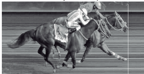
Electric y Sapporo